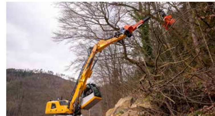
Per tutti gli escavatori d'uso commerciale.